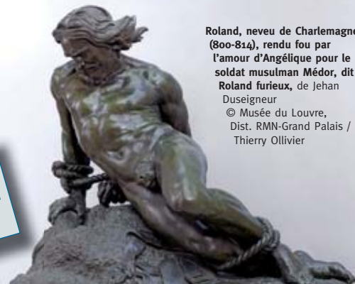
Roland, neveu de Charlemagne (800-814), rendu fou par l'amour d'Angélique pour le soldat musulman Médor, dit Roland furieux, de Jehan Duseigneur © Musée du Louvre, Dist. RMN-Grand Palais / Thierry Ollivier