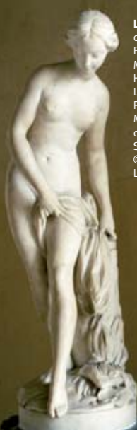
La Baigneuse de Etienne Maurice Falconet (1716-1791) Marbre. H. 0,8 m. L. 0,25 m. Pr. 0,29 m. Musée du Louvre, département des Sculptures, MR 1846