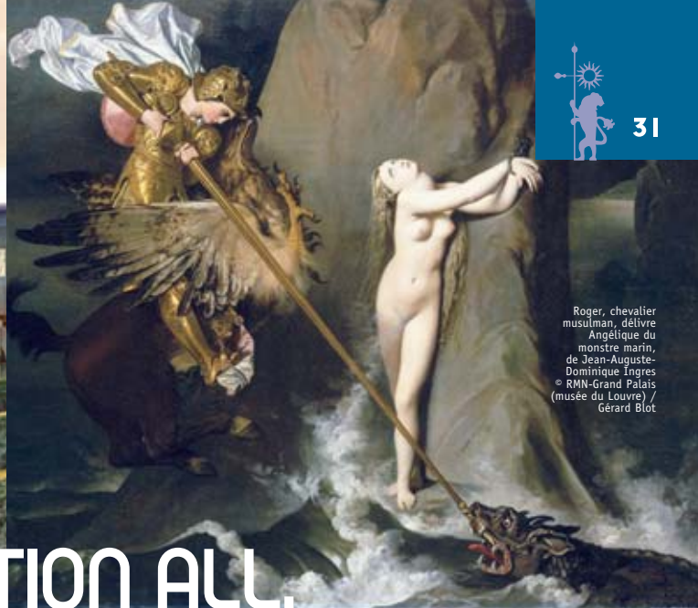
Roger, chevalier musulman, délivre Angélique du monstre marin, de Jean-Auguste-Dominique Ingres

Découvrez "l'autre Louvre" en compagnie d'un guide-conférencier (descriptif p16)