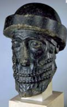
Portait royal : le roi de Babylone Hammurabi ? Butin de Babylone, Mésopotamie, vers 1900 avant J.-C., Diorite