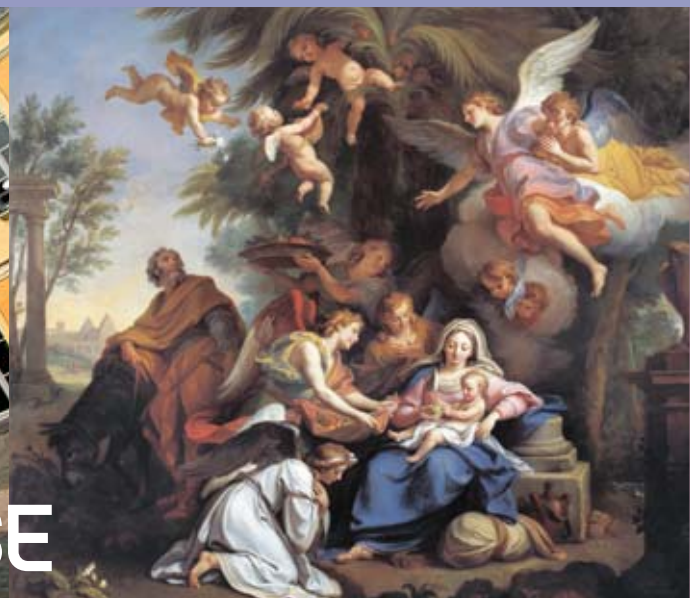
Le Repos pendant la fuite en Egypte, Louis de Boullogne, 1715