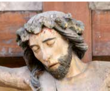
© Citution & Ensemble - M. Porro