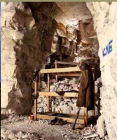
© Citution &amp; Ensemble - D. Cordonnier