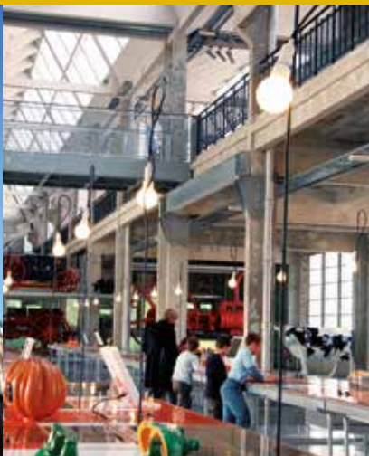
© Citution & Ensemble - M. Porro