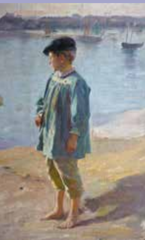
"Enfant au bord de l'eau" de Paul-Émile Boutigny (collection du musée)