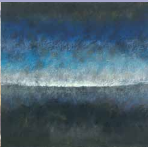
"Horizon perdu", 1981, de Paul Hemery (Frac Nord-Pas-de-Calais)