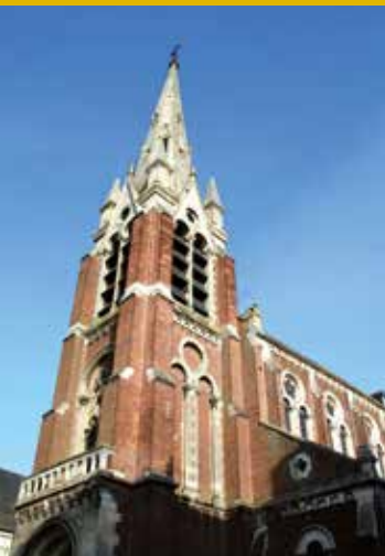
© Citution & Ensemble - D. Cordonnier